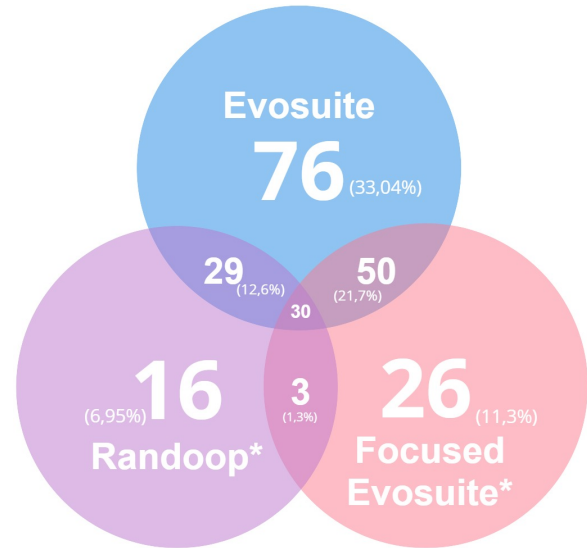
Figura 8: Diagrama de Venn dos conflitos detectados por cada ferramenta.

Em relação às configurações do Focused EvoSuite , embora seus testes tenham detectado um número menor de conflitos, suas detecções contribuíram de maneira significativa reportando 26 conflitos exclusivos (11,3%). Essa constatação enfatiza a importância de empregar ferramentas com abordagens distintas e integrar seus resultados para uma análise mais completa. O EvoSuite gera suítes de teste que atendem a uma série de critérios para toda a classe. Em contraste, o Focused EvoSuite concentra seus esforços apenas nos métodos modificados. Assim, o Focused EvoSuite utiliza todo o seu tempo alocado para satisfazer os critérios de teste dos métodos modificados, onde os conflitos são mais prováveis de ocorrer. Portanto, podemos dizer que sua abrangência é menor, mas ele explora mais sistematicamente o que abrange. Um exemplo disso ocorre no